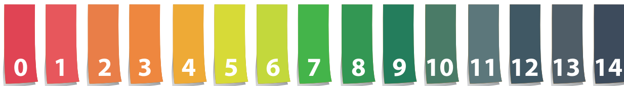
Scala dei valori di pH